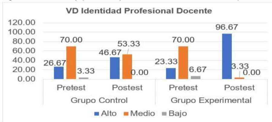
Figura 1. Niveles y porcentajes de la variable Identidad profesional docente

En la figura 1, en el pretest, el GC y GE se ubicó en el rango medio con 70.00% ambos grupos en el posttest el grupo experimental (GE) logro el 96.67% nivel alto, resultado que evidencia los efectos del programa.