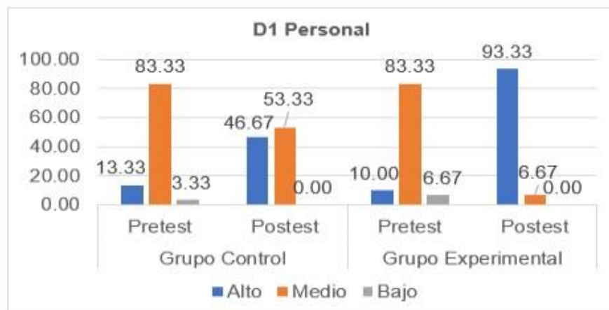
Figura 2. Niveles y porcentajes de la dimensión personal

En la figura 2, en el pretest, el GC y GE se ubicó en el rango medio con 83.33%, en el posttest el GE logró el 93.33% nivel alto, observándose los efectos del programa.