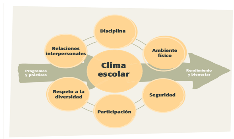
Figura 1. Factores que influyen en el Clima Escolar

uno de sus compañeros y docentes (Mardones, 2023). En la Figura 1, se observa seis factores esenciales los cuales han sido identificados como influyentes dentro del clima escolar, estos son la disciplina, el ambiente físico, la seguridad, la participación, el respeto a la diversidad y las relaciones interpersonales.